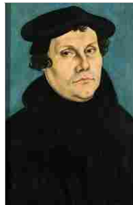
La riforma di Martin Lutero

Prova a guardare il video su www.youtube.com oppure attiva JavaScript se