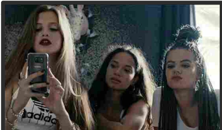
Una scena di 'Blue my mind'

La giuria del Premio Camera D'oro Alice/Taodue ha deciso di premiare il film Blue My Mind di Lisa Bruhlmann con la seguente motivazione "un racconto di formazione che si trasforma in fantasy, una storia di mutazione e di trasformazione. Un esordio che stupisce ed ha anche in se un messaggio liberatorio". È quella della quindicenne Mia che dopo aver traslocato con i genitori alle porte di Zurigo, si butta in una selvaggia adolescenza cercando di fronteggiarla, il suo corpo comincia a cambiare in modo strano. All'inizio in modo poco percettibile, ma successivamente con una veemenza che la manda fuori di testa. Nella sua disperazione, cerca di anestetizzarsi con sesso e droghe, sperando di fermare questo fiume in piena che la sta travolgendo. Ma la natura è più forte.